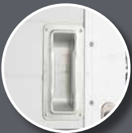
Embedded handle/ Muschelgriff