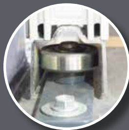
Solid bottom guide rollers/ Stabile Rollen- Bodenführung