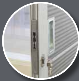
Side lock or floor lock options/ Seitenverriegelung - optional Bodenverriegelung